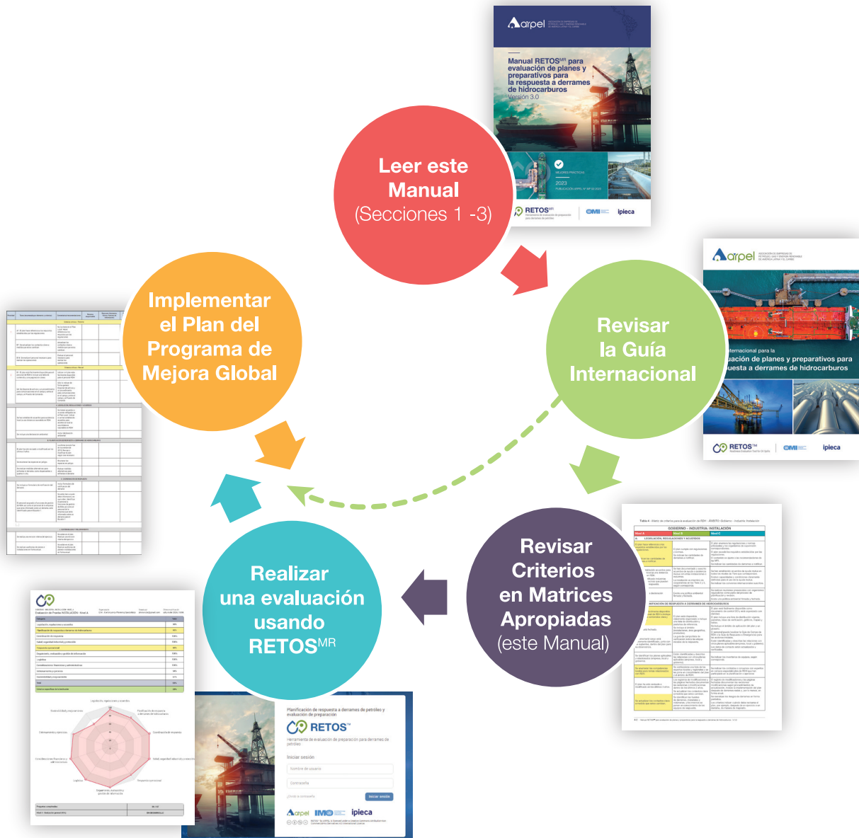
Figura 1 - Visión general de cómo utilizar este Manual y la aplicación web de RETOS MR