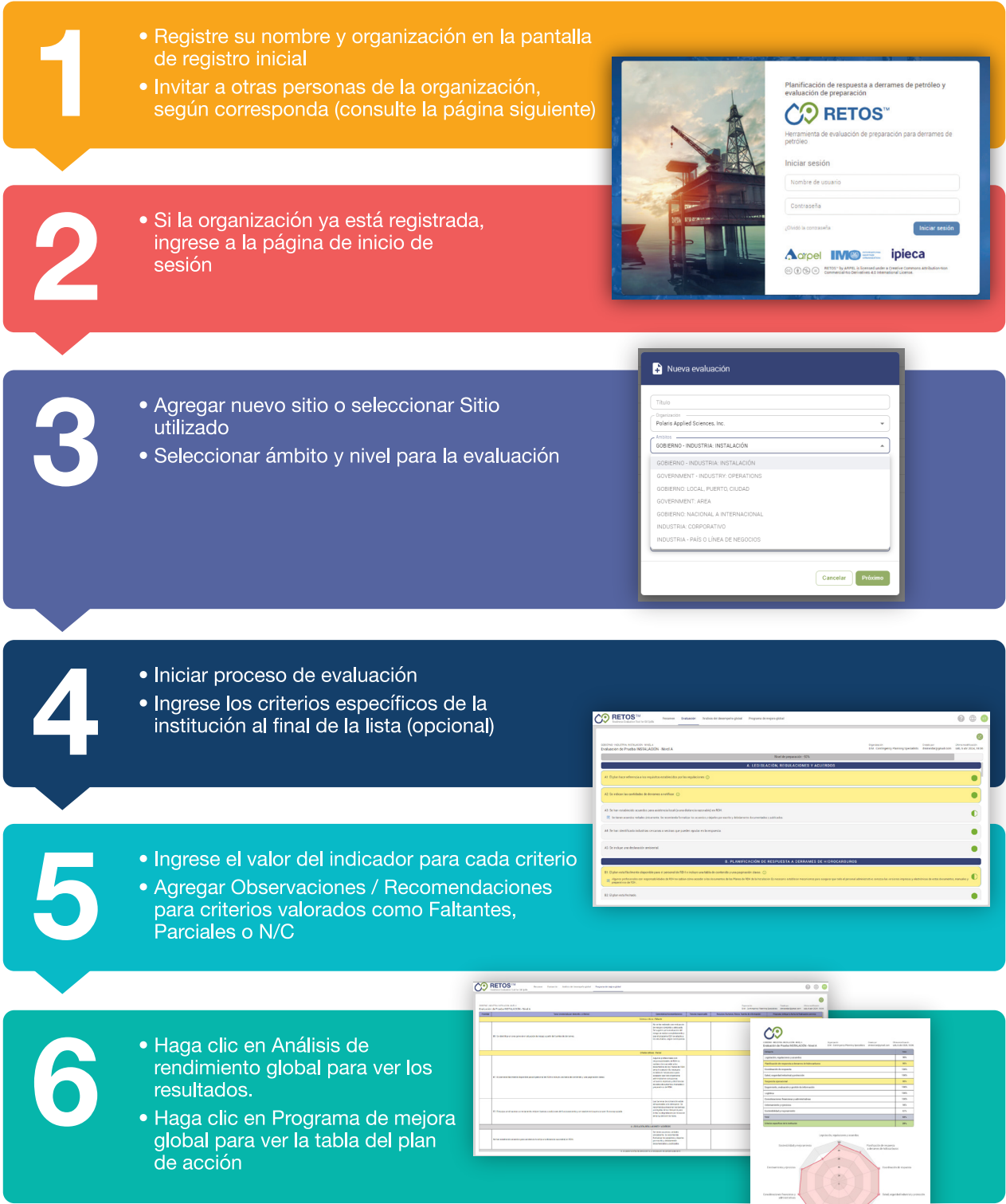
Figura 2 - Pasos en el uso de la aplicación web de RETOS MR